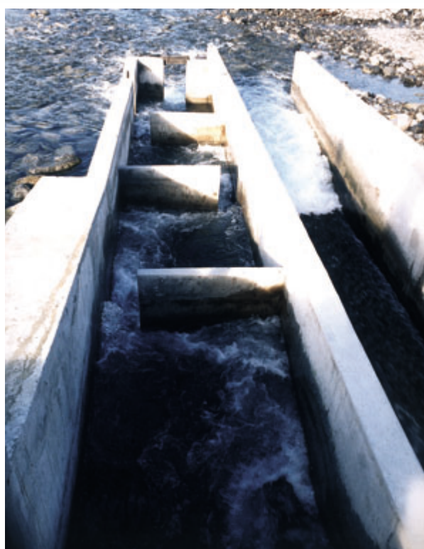
Passé à poissons et délivrance du débit réservé.